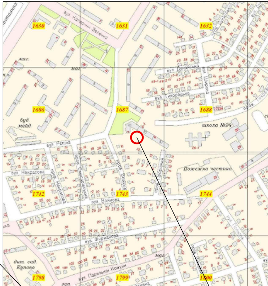
Ситуаційний план М 1:5000